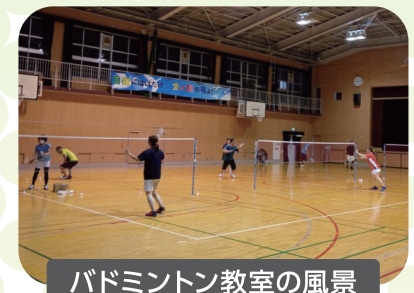
バドミントン教室の風景