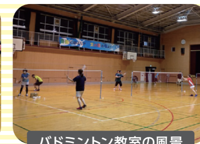
バドミントン教室の風景