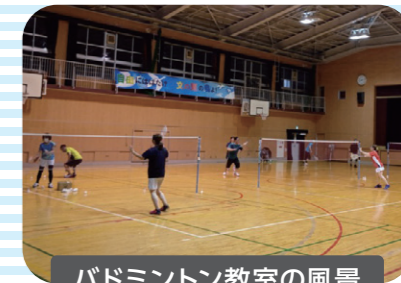
バドミントン教室の風景